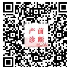
第四次产前诊断学术会议