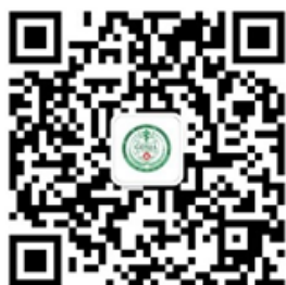
广东省医学会学术交流