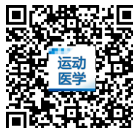
运动医学年会微官网