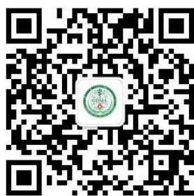
广东省医学会学术交流

欢迎浏览广东省医学会网站： www.gdma1917.cn 或 www.gdma.cc 。或关注微信公众号。