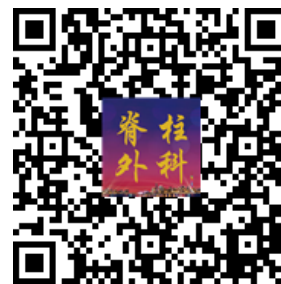
脊柱年会微信报名二维码