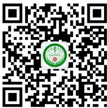
广东省医学会风湿病学分会

有关会议最新消息欢迎浏览网站 http://gdmafs2019.medmeeting.org 或关注微信公众平台：广东省医学会风湿病学分会或广东省医学会学术交流