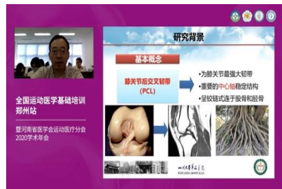
李箭教授 《全关节镜下胫骨 Inlay 技术重建 PCL》