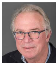
Hidde Ploegh 美国科学院院士 波士顿儿童医院