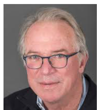
Hidde Ploegh 美国科学院院士 波士顿儿童医院