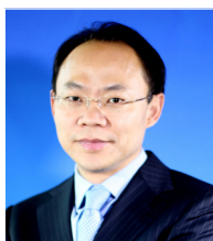
程京 院士 清华大学医学院