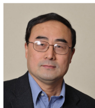
Wanjun Chen 教授 美国国立卫生研究院