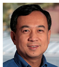
董晨 院士 清华大学医学院