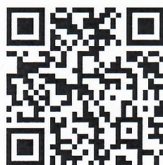
大会注册二维码(手机端)